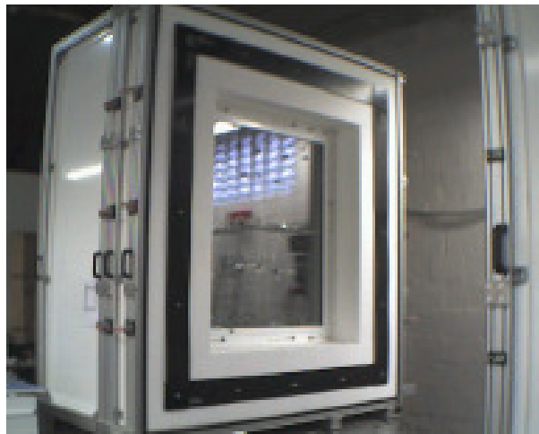
Abb. 2: Geöffnete Hotbox mit eingebauter Probe.

Der Probekörper wird zwischen zwei Räume mit unterschiedlichen Temperaturen eingebaut (siehe Abb. 1). Im stationären Fall fließt ein konstanter Wärmestrom von der warmen Seite durch den Probekörper auf die kalte Seite.