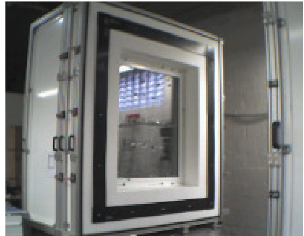
Fig. 2: Open hot box with sample.

The sample is installed between a hot chamber and a cold chamber (see Fig. 1). In a steady state, heat flows constantly from the hot side through the sample to the cold side.