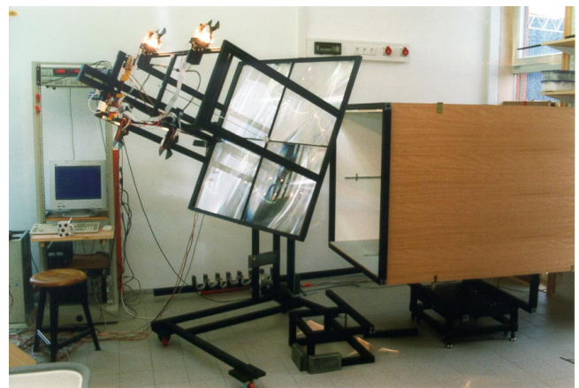
Abb. 2: Apparatur zur Charakterisierung von Tageslichtsystemen.